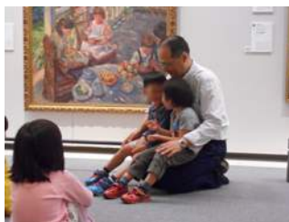
絵のなかの男の子になってみる

「どんないろがすき？」「その色は、どんな名前かな？」「キラキラ色」「あったかい色」「どこどこ色」。子どもたちはいろんな思いをイメージして自分の色をつくり名前を付けました。自分たちの色ができると「〇〇ちゃんの色ってどんな色？」「こんな色」とみんなに見せながら「□□色♪」と発表します。そして、ウッドブロックに合わせて、友達と手を繋いでみたり、集まってみたり、一人で表現してみたりして子どもたちがその時々思い付いた自由な表現を楽しみました。