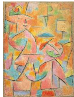
パウル・クレー 〈子供と伯母〉 1937年 徳島県立近代美術館蔵

美術館職員の案内で鑑賞を楽しむ他、アトリエでお絵描きなど制作も体験できますので、近代美術館までお問い合わせください。