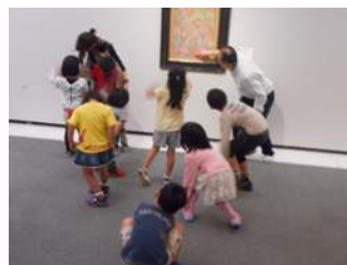
線や形や色を身体で表現しているよ