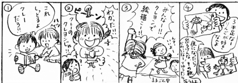
色んなお話が出来て楽しめました