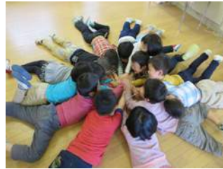
いろをみんなで表現したよ