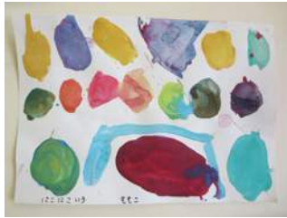
色の名前は「にここいろ」